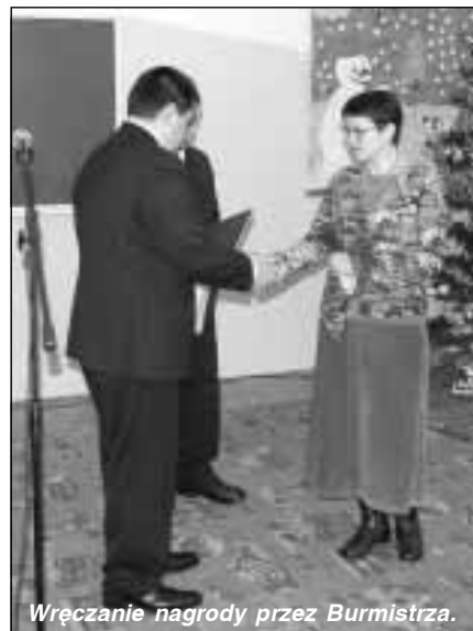
Wręczenie nagrody przez Burmistrza.