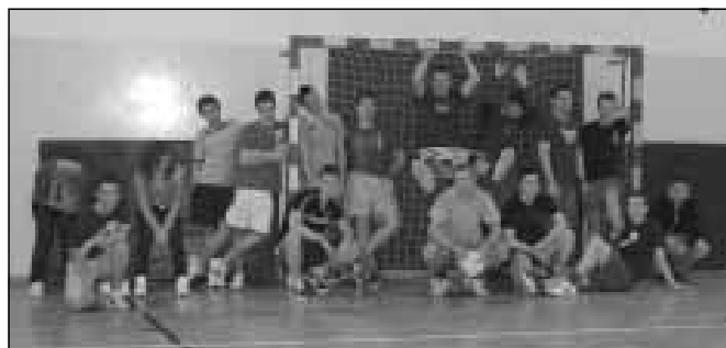
Zajęcia sportowe, komputerowe, taneczne realizowane w ramach Projektu w Kątach Trzebuskich.

U wielu osób można zauważyć zmianę, dotyczącą kształtowania charakteru w lepszym kierunku (innym niż dotychczas),