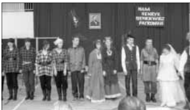
Grupa teatralna z ZS Nr 1 w Nienadówce.