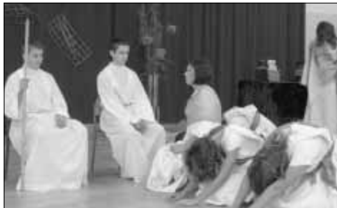
Grupa teatralna z ZS Nr 2 w Nienadówce