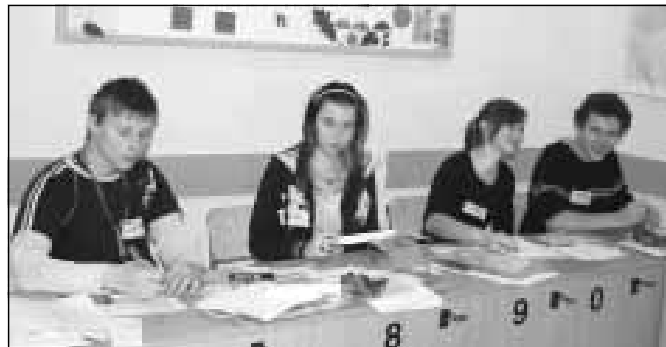
Szkolenie w Gminnym Gimnazjum im. Jana Pawła II w Raniżowie.