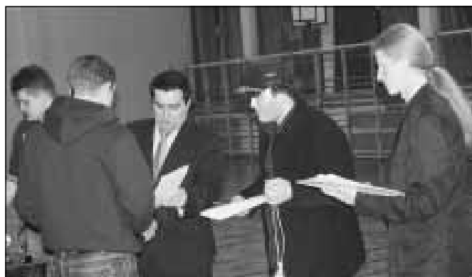
Wręczenie dyplomów przez Burmistrza GiM.

Całe rozgrywki zostały podzielone na dwa etapy. W pierwszym meczu rozgrywane były w systemie „każdy z każdym”. Do drugiego etapu awansowało osiem zespołów z miejsc od pierwszego do ósmego, które grały systemem „play off”, gdzie zespół przegrany odpadał z dalszych rozgrywek. W ćwierćfinałach spotkały się zespoły: TG Sokół-Leszcze (9-4), Falcon-Ziomki (5-8), Plantator-Górnovia (9-4) oraz Sokołowianka-Zorza Trzeboś (8-5). Do półfinału awansowali zwycięzcy meczy ćwierćfinałowych. Ziomki z Górna pokonując zespół Plantato-