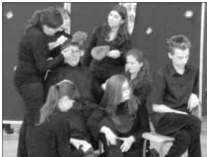
Grupa teatralna z Gimnazjum nr 7 w Rzeszowie.