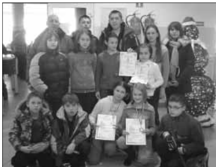
Zawodnicy Klubu pływackiego „Delfinek” z trenerem.