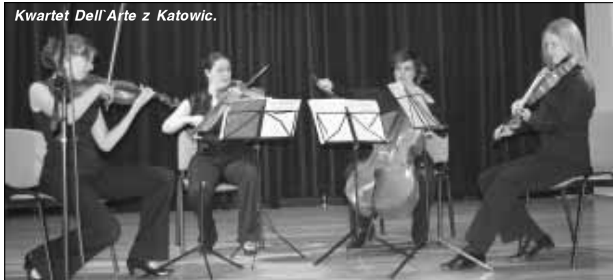
Kwartet Dell'Arte z Katowic.

ry, Sportu i Rekreacji w Sokołowie Małopolskim w ramach zajęć nazywanych potocznie „kółkiem tanecznym”. Dziewczynki przedstawiły układ choreograficzny do muzyki z filmu „Flinstonowie”.