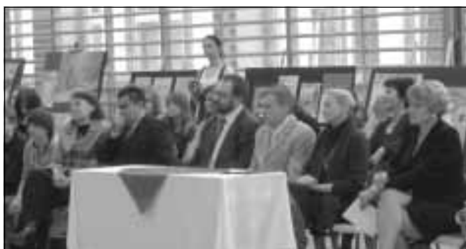
Zaproszeni goście oraz jury konkursu.