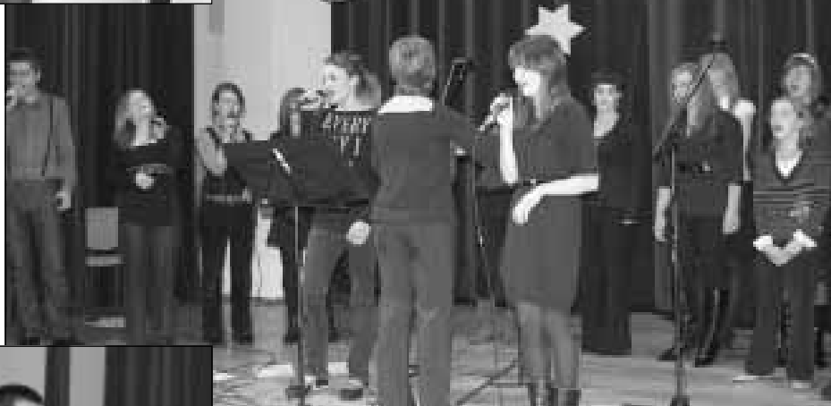
Występ młodzieży biorącej udział w zajęciach wokально-instrumentalnych.