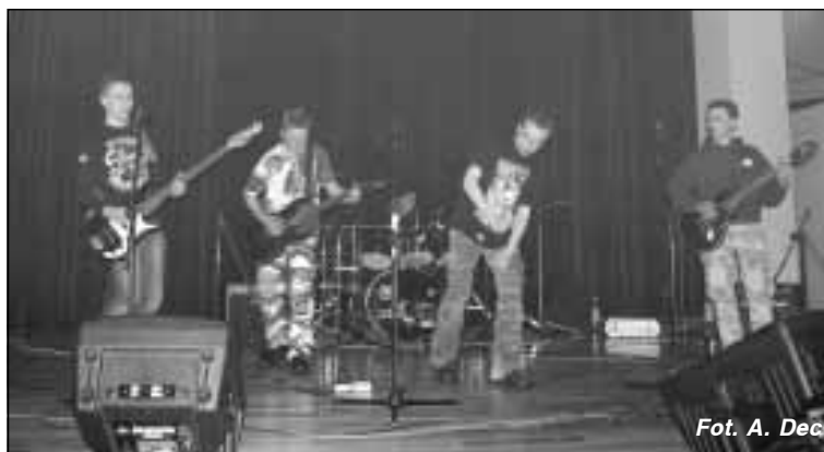
Koncert zespołu Phobia.