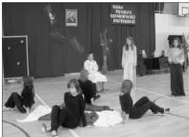
Grupa teatralna z ZS Nr 1 w Nienadówce.