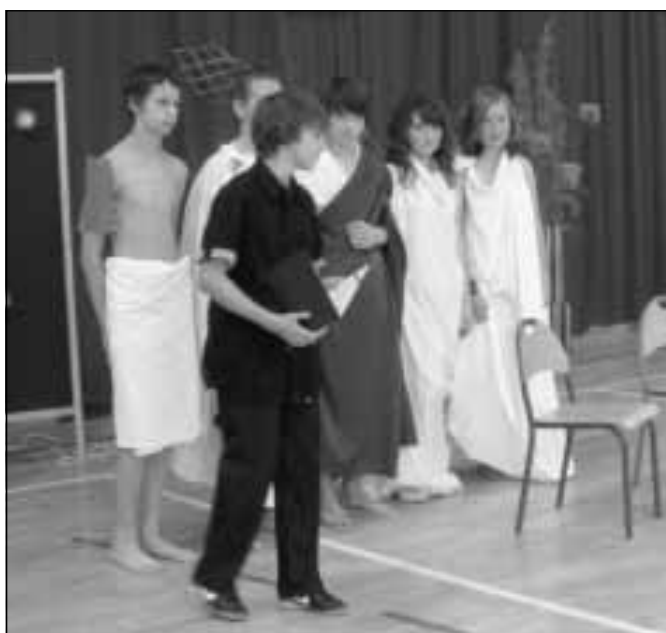
Grupa teatralna z ZS w Sokółowie Młp.