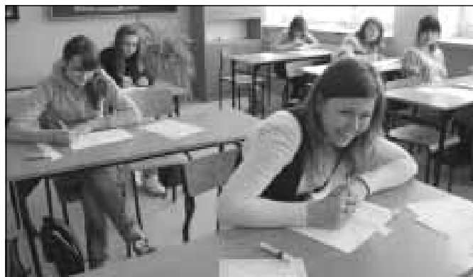
Szkolenie w Zespole Szkół im. Jana Pawła II w Sokołowie Młp.

02.02.2010 r. w Gminnym Gimnazjum im. Jana Pawła II w Raniżowie w ramach projektu „Inkubator Wiedzy Ekonomicznej” odbył się konkurs „Najlepszy ekonomista” w szkole gim-