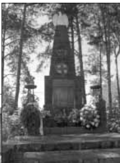
Pomnik Ofiar Pacyfikacji w Woli Zarzyckiej.