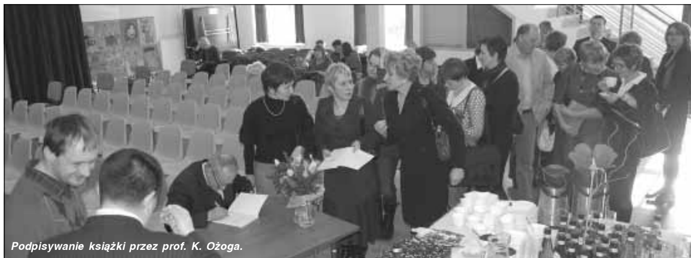
Podpisywanie książki przez prof. K. Ożoga.