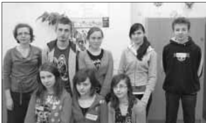
Szkolenie w Zespole Szkół im. Św. St. Kostki w Kamieniu.

Podczas szkolenia młodzież poszerzyła swoją wiedzę w zakresie podstawowych pojęć ekonomicznych. Poprzez udział w szkoleniu młodzież zwiększyła motywację do po-