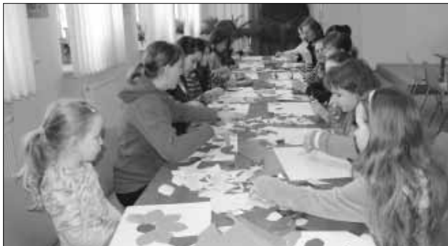
Zajęcia plastyczne i ruchowe.