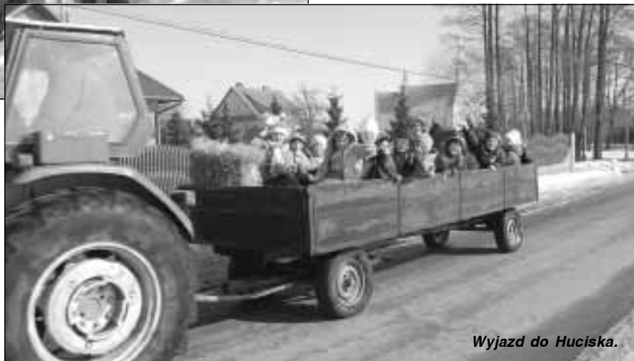
Wyjazd do Huciska.

Jadąc ośnieżonymi leśnymi drogami można było się delektować przepięknymi zimowymi krajobrazami. Ten całokształt zimowej aury dzieci doskonale