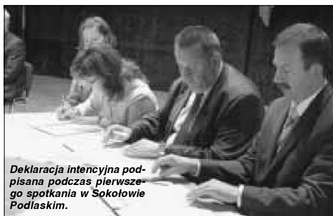
Deklaracja intencyjna podpisana podczas pierwszego spotkania w Sokółowie Podlaskim.

zrównoważonego rozwoju miast „sokolich” współcześnie, to cechy wspólne, które łączą Sokółów Podlaski, Sokółów Małopolski, włoskie Montefalco i czeski Sokolov. To także solidna podstawa do budowania partnerstwa tych miast w celu