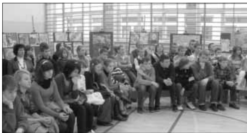
Zdobywcy nagród razem z opiekunami.