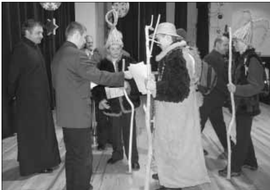
Wręczenie nagród laureatom.

Nie dziwota, że Kolędnicy z trzebońskiej „dwójki” i górneńskie „Draby” zajęli na prestiżowym XIII Ogólnopolskim „Pa-