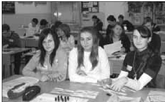
Szkolenie w Zespole Szkół im. Jana Pawła II w Sokołowie Mtp.