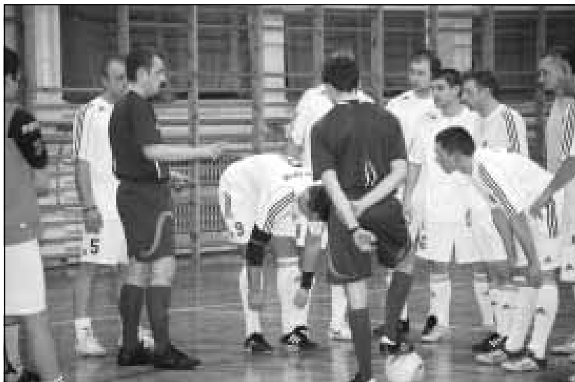
Przygotowanie do meczu.