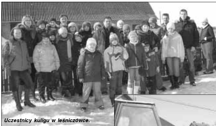
Uczestnicy kuligu w leśniczówce.

oddały w pracach sporządzonych w ramach naszych zajęć plastycznych po kuligu.