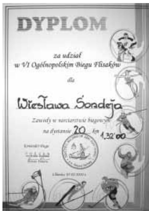
Dyplom z zawodów narciarskich.