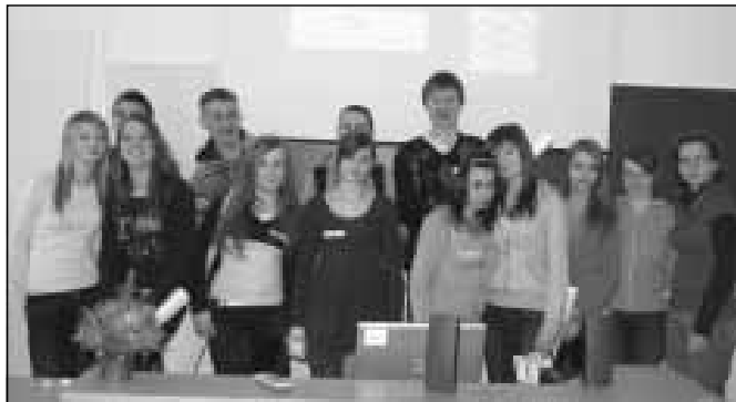
Szkolenie w Gminnym Gimnazjum im. Jana Pawła II w Raniżowie.