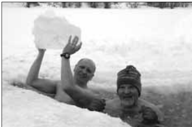
Mors podczas zażywania kąpieli z kolegą.