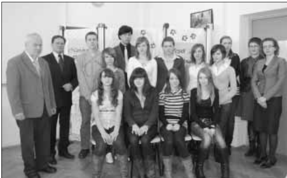
Zakończenie projektu Inkubator Wiedzy Ekonomicznej.

Dzięki udziałowi w projekcie młodzież uzyskał możliwość uzupełnienia wiedzy zdobywanej w trakcie nauki w szkole oraz okazję do zdobycia umiejętności pracy w grupie. Projekt zapewnił rozwój kontaktów interpersonalnych wśród młodzieży