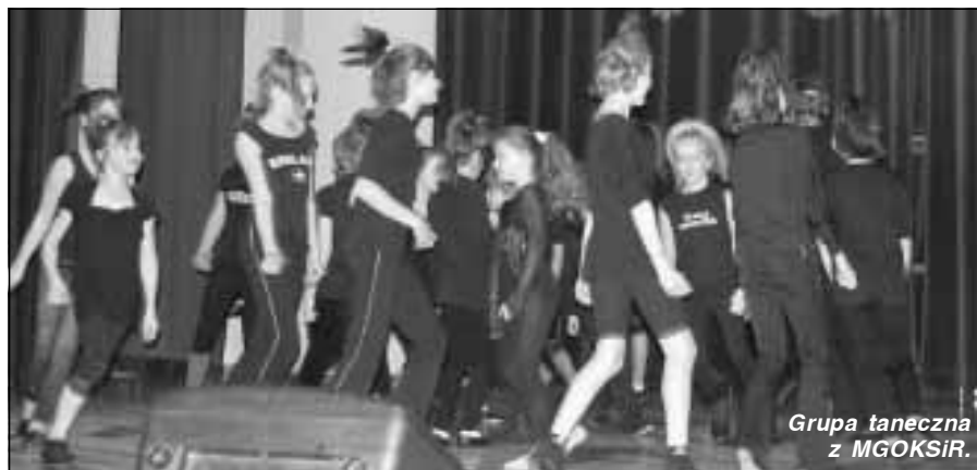
Grupa taneczna z MGOKSiR.

Koncert trwał prawie dwie godziny, ale występujący nie dali się nudzić słuchaczom i oglądającym. Różnorodność stylistyczna utworów, sposób prezentacji, ich aranżacja, szczególnie choreografia układów tanecznych, powodowały ciągłe zaciekanie i zain-