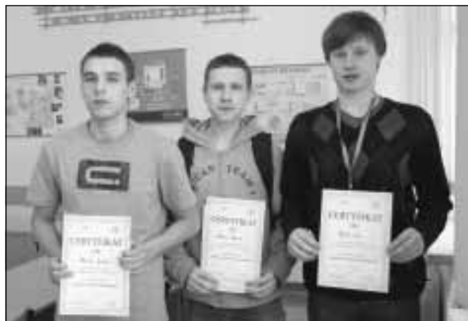
Szkolenie w Gminnym Gimnazjum im. Jana Pawła II w Raniżowie

I. Konkurs „Najlepszy ekonomista” w szkole gimnazjalnej w Gminnym Gimnazjum im. Jana Pawła II w Raniżowie w ramach projektu Inkubator Wiedzy Ekonomicznej