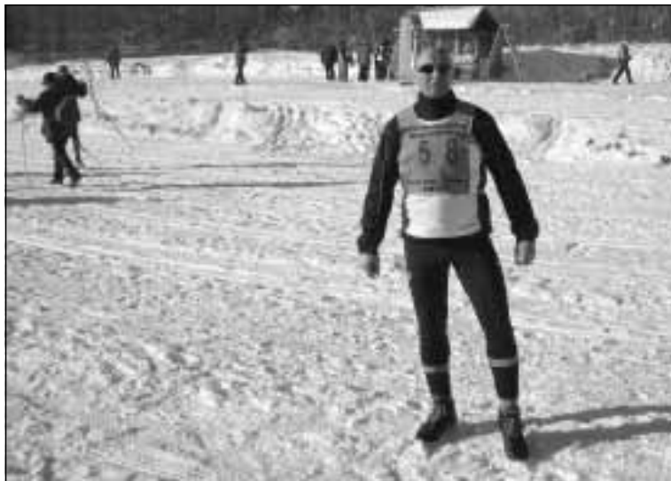
Przed startem w zawodach.

24 stycznia 2010 roku pomimo siarczystego mrozu na starcie 23 edycji Bieszczadzkiego Biegu Lotników w Ustianowej stanęło ponad 90 zawodników i zawodniczek z regionów Podkarpacia, Małopolski, województwa mazowieckiego, oraz z Ukrainy. Biegi narciarskie, po pływaniu są dyscypliną w której zaangażowane są wszystkie mięśnie, dlatego też trzeba mieć bardzo dobrą kondycję żeby sprostać wymaganiom organizatora. Zdecydowałem się biec na dystansie 21 km (3 okrążenia x 7 km). Trasa ciężka dużo podbiegów i zjazdów, ale wspaniała publiczność zachęcała do walki. Wynik 2:05:04 nie odbiegał od wytrawnych biegaczy. Dla mnie to wspaniała impreza, nabranie pewności siebie że to nie jest takie trudne, trzeba tylko chcieć. W planie następne biegi narciarskie z uczniami.