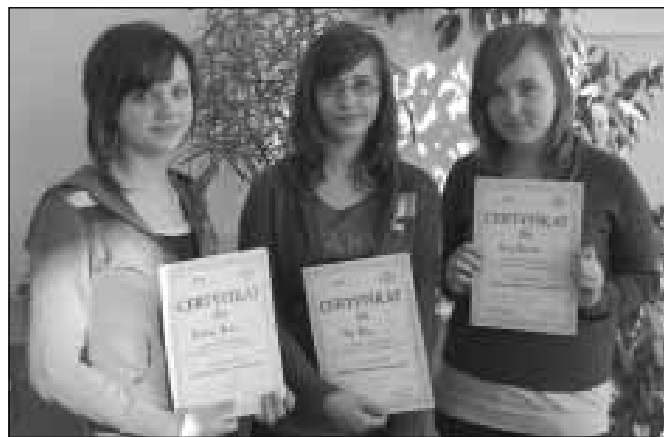
Szkolenie w Zespole Szkół im. Św. St. Kostki w Kamieniu.