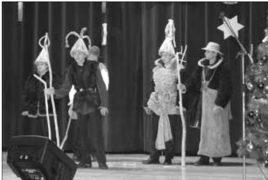
Występ zespołu kolędniczego z Górna w tradycyjnych strojach lasowiackich.

z własnej woli załapać. Trzeba byłoby być odludkiem, albo bardzo utraconym na zdrowiu, żeby choć po Szczodrakach w Nowy Rok parę obejść nie odwiedzić. A teraz? Nie potrzeba nam socjologiczno-pedagogiczno-teologicznych analiz, by skonstatować przykry regres w tej mierze. Owszem tak gdzieś do 2000 roku obserwowało się zjawisko totalnej „jasełkizacji”, gdyż wszyscy w szkołach, parafiach, remizach oraz domach i ośrodkach kultury za ambit sobie stawiali wystawienie jasełek, Herodów, widowisk w tym Kolęda z rajem, z kozą i podobnych nie licząc tu koncertów realizowanych przez rozmaite chóry. Teraz nastał czas zaniechania realizacji takich „niemodnych” widowisk. Europejczykami na całego jesteśmy przecież! Niestety owa niedobra fala pogardy dla uświęconej tradycji przodków przytłęła także do regionu lasowiackiego tak bogatego w zwyczaje i obrzędy Bożonarodzeniowe. Zaznaczyła się zatem m.in. nikłością zainteresowania IX Miejsko-Gminnymi Prezentacjami Zespołów Kolędniczych i Widowisk Jasełkowych w Sokołowie Młp. Praktycznie to tylko dwie miejscowości: Górno i Trzeboś wypełniły szranki prezentacyjne. Ani mi w głowie dopytywać się u źródeł ile