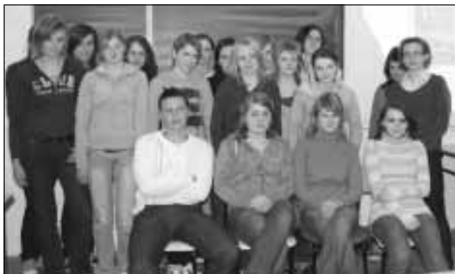
Szkolenie w Zespole Szkół w Sokołowie Młp.

Podczas szkolenia młodzież poszerzyła swoją wiedzę w zakresie podstawowych pojęć ekonomicznych. Poprzez udział w szkoleniu młodzież zwiększyła motywację do po-