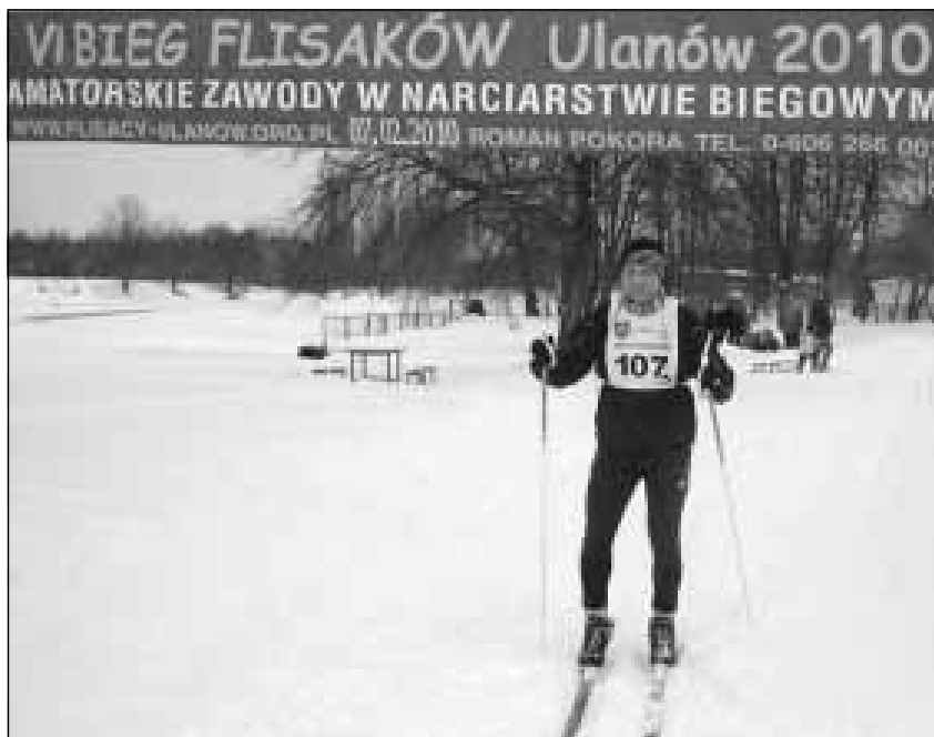
Na mecie biegu narciarskiego.