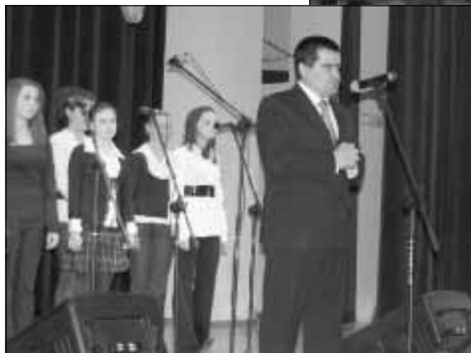
Wystąpienie Burmistrza GiM Sokotów Młp.

i gminnymi. Na uczestników spotkania, czekał też poczęstunek, który został przygotowany przez osoby uczęszczające na zajęcia kulinarne. Następnie odbyła się dyskoteka, w której młodzież chętnie i licznie wzięła udział.