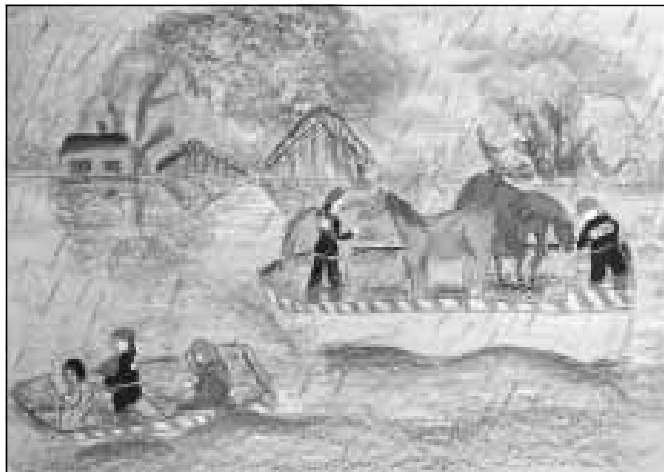
Praca Aliny Szczygiele.