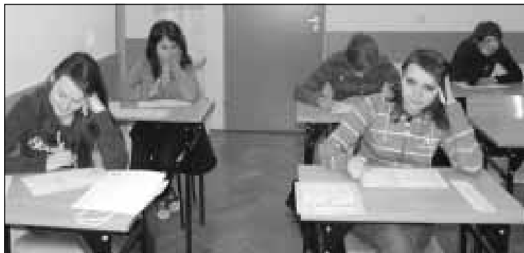
Szkolenie w Zespole Szkół w Sokołowie Młp.